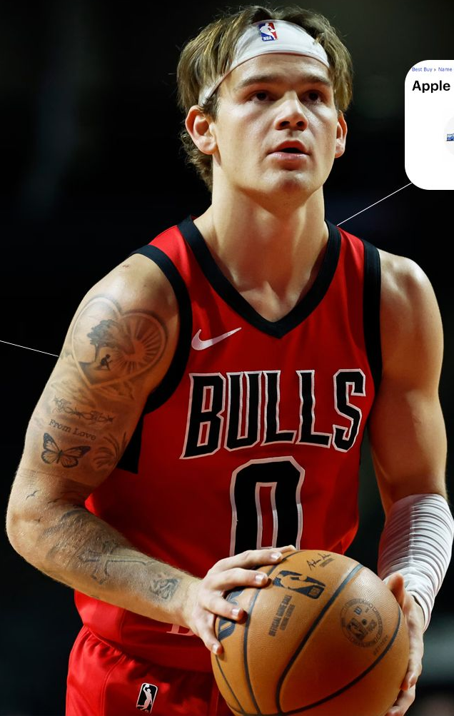
Mac McClung Chicago Bulls player